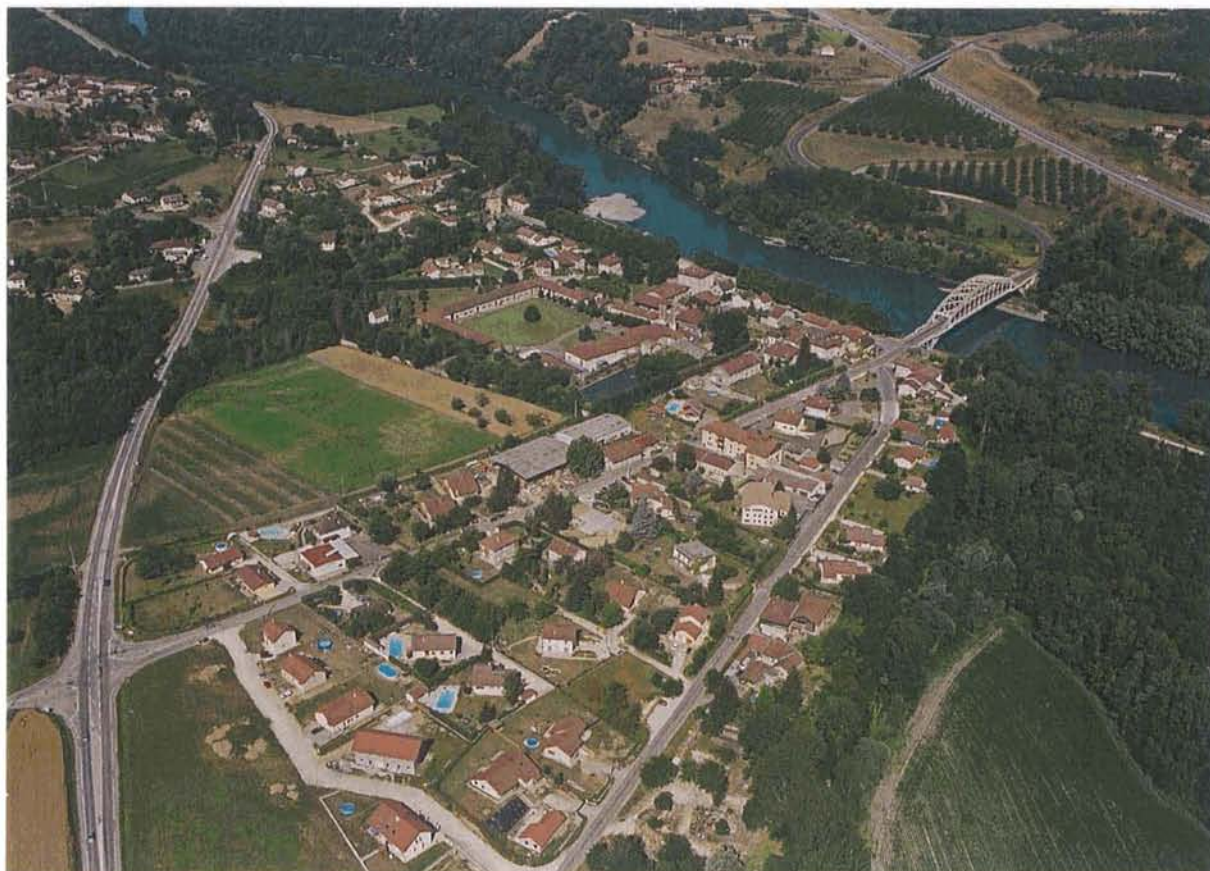
Le développement du Port

En conséquence, le Plan Local d'Urbanisme a pour objectif la mise en place de conditions devant permettre une croissance maîtrisée, à la fois spatialement mais aussi dans le temps, compatible avec le respect des équilibres actuels (place de l'agriculture, des espaces naturels, des hameaux).