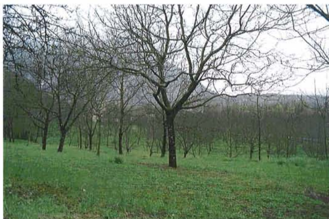
Une noyeraie sur la plaine

Le Plan Local d'Urbanisme a pour objectif de lever les incertitudes pouvant peser sur des portions importantes du territoire agricole (surtout dans la plaine) par l'affirmation de limites claires entre périmètres urbanisés ou urbanisables et zones agricoles.