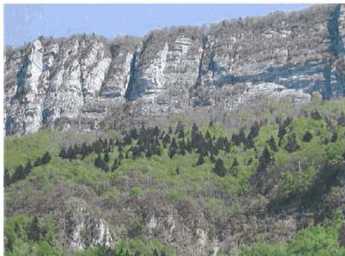
Le Parc Naturel Régional du Vercors et l'Espace Naturel Sensible des Ecouges sont la preuve d'une richesse environnementale à préserver

Elle possède également une bonne fonctionnalité de ses écosystèmes liée à l'équilibre entre les différents types de milieux naturels et agricoles. Les enjeux environnementaux de Saint-Gervais vont être de préserver ses atouts, richesses et équilibre, de se prévenir contre les risques et les nuisances et enfin de lutter contre ces nuisances à leur source.